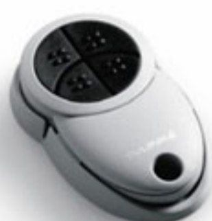
Μίνι πομπός δύο καναλιών