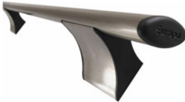
ΧΡΩΜΑ : ΝΙΚΕΛ ΣΑΤΙΝΕ