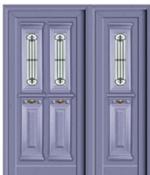
E31.12 / K1