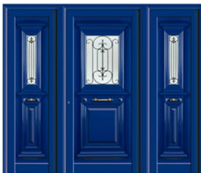
E36.12 / K2