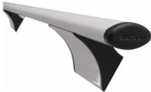
ΧΡΩΜΑ : ΛΕΥΚΟ