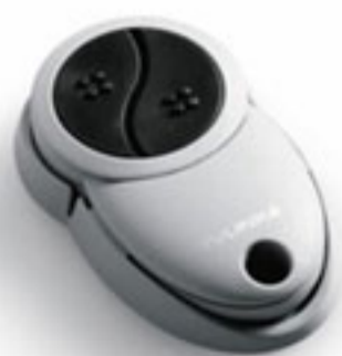
Μίνι πομπός ενός καναλιού