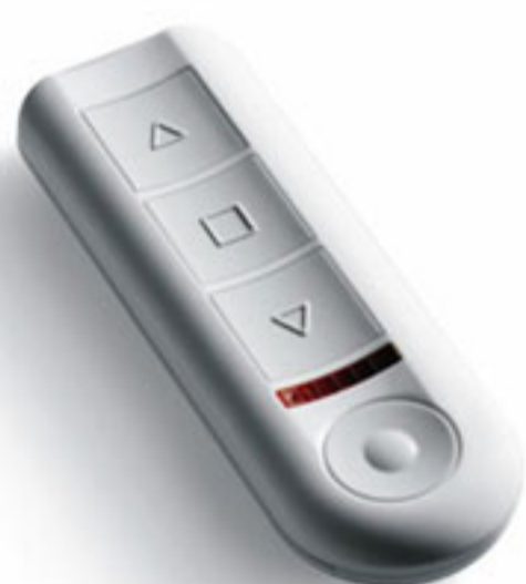
Πομπός 6 καναλιών