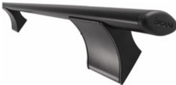
ΧΡΩΜΑ : ΜΑΥΡΟ