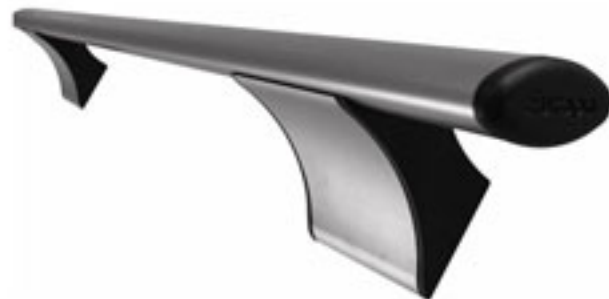
ΧΡΩΜΑ : ΧΡΩΜΙΟ ΣΑΤΙΝΕ

Εύκολη εφαρμογή σε όλους τους τύπους συρόμενων κουφωμάτων και μετά την τοποθέτηση. Προσφέρουν μεγάλη άνιση στην κίνηση των φύλλων.