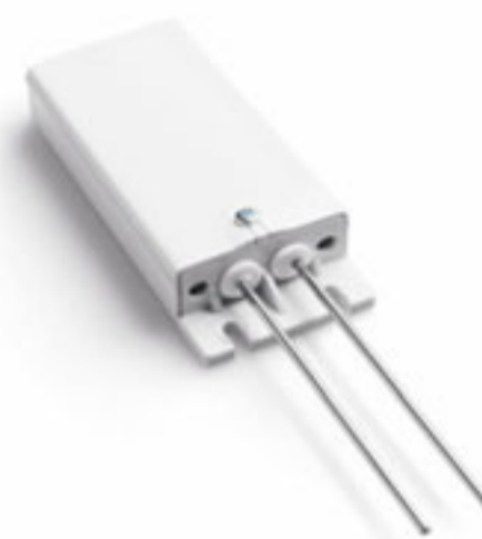
Αισθητήρας διαρροής νερού